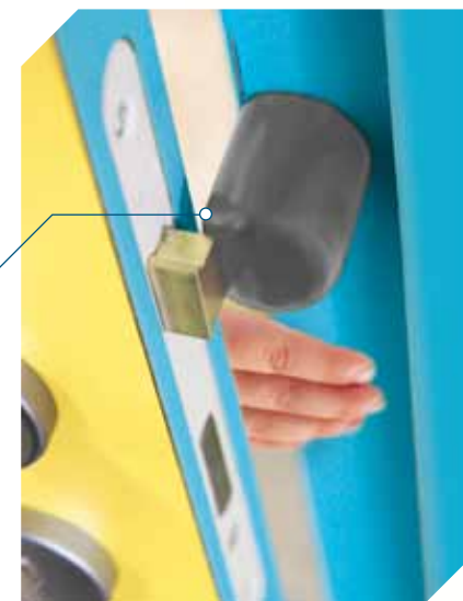
Pêne carré avec dispositif d'arrêt